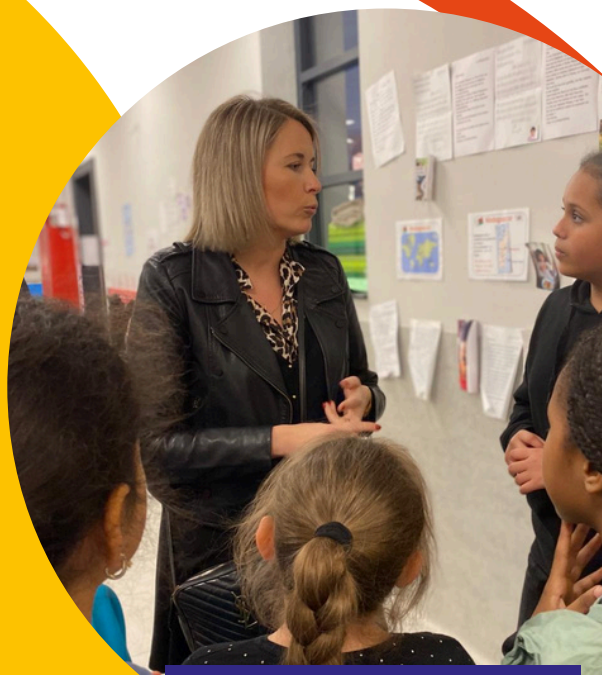
Déborah Gérardon Bourgmestre de Seraing

A quelques semaines de l'opération, la commune se montre très investie en mobilisant déjà les agents de son administration communale : relai à vélo pour chaque membre du collègue communal, le tapis rouge de pièces ou encore le défi de deathride sur la place Kuborn organisé avec l'armée et l'intercommunale d'incendie liégeoise.